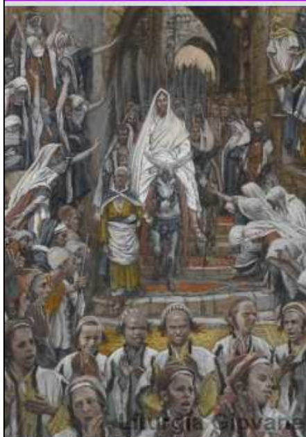
Processione per le strade di Gerusalemme James Tissot

LA MESSA ALLA DOMENICA E NEI GIORNI FESTIVI